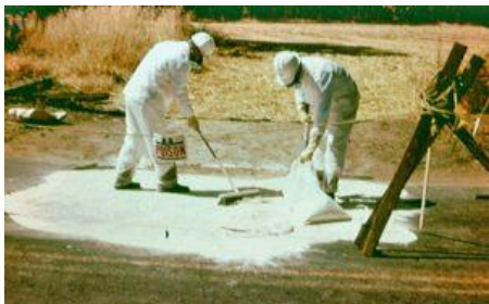
IZLIVANJE TOKOM PUNJENJA PRSKALICA, PRI APLIKACIJI SZB I PRI MANIPULACIJI

Svako rukovanje SZB može dovesti do akcidenta. Najbolje je SZB koje će se primeniti u polju, sipati u prskalicu i razblažiti u vidu pripremljenog rastvora pre kretanja na parcelu. Aplikant SZB u polju mora imati dovoljne količine čiste vode, adsorbens i oruđe ( lopata, džakovi i sl. ) za slučaj da ipak dođe do prosipanja SZB van mesta primene.